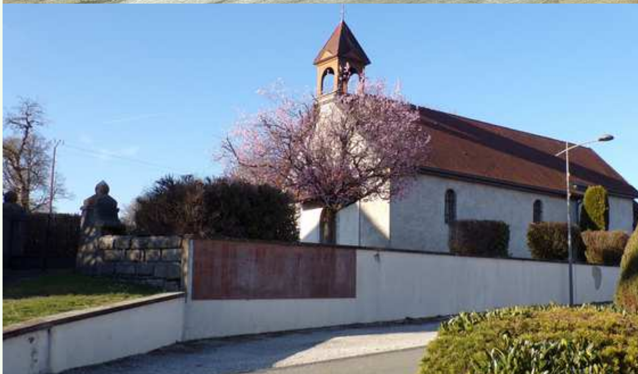
La chapelle de Santoche en hiver 1955 : gouache d'André Cordelier tirée d'un carnet de croquis au dessus, et le même édifice au printemps 2019 : peu de changement en une soixantaine d'années...