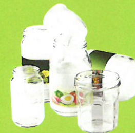
Pots & bocaux en verre