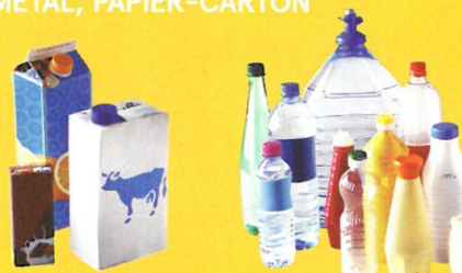
Briques en carton

EMBALLAGES EN PLASTIQUE, MÉTAL, PAPIER-CARTON