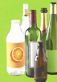
Bouteilles en verre